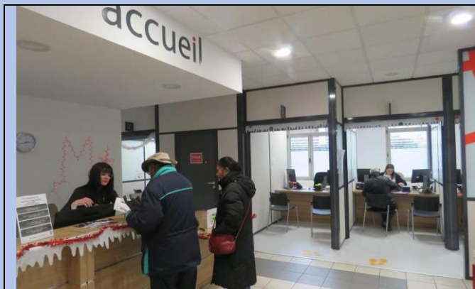
Hôtel-de-Ville de Melun, jeudi 5 décembre 2019 : hall d'accueil de la mairie, in leparisien.fr , 09/12/2019.

Espace des services publics : établissement scolaire, mairie, tribunal. etc. C'est le lieu du bien commun, de l'intérêt général, qui n'est pas la somme des intérêts particuliers (...) Les programmes scolaires ne sont pas la somme des interventions de différents groupes de pression, mais ce que la Nation, à un moment donné, entend promouvoir auprès des élèves. Ils doivent être à l'abri de toute propagande et prosélytisme religieux, politique ou commercial. C'est ce que garantit la neutralité de l'État et l'impartialité de ses fonctionnaires.**