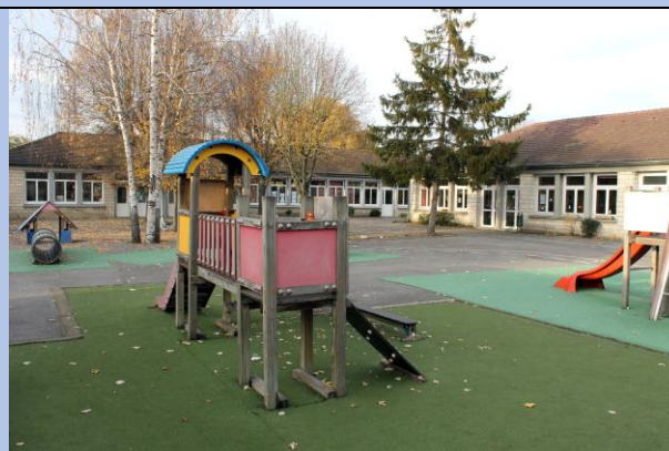
Groupe scolaire Carnot à Nogent-sur-Oise, in www.nogentsuroise.fr