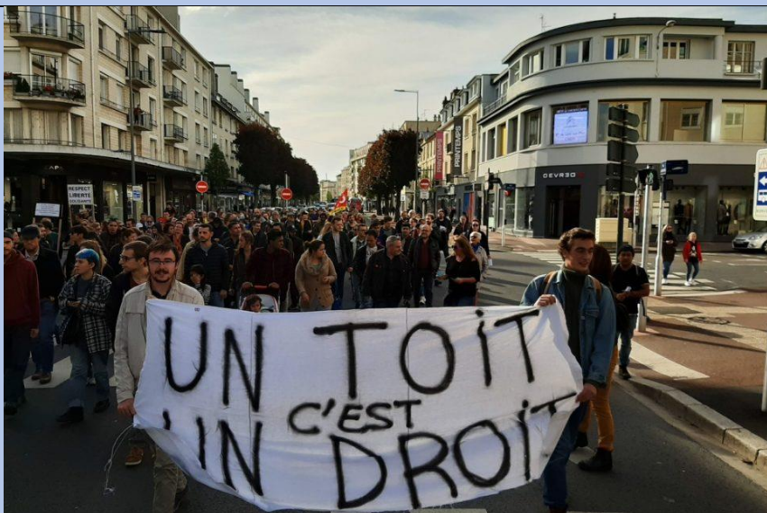
Manifestation à Caen le 26 octobre 2019, in Liberté, le Bonhomme Libre

Espace public partagé : la rue, les transports, où chacun peut, dans le respect de la loi, afficher ses opinions, ses croyances, mais où sa liberté s'arrête où commence celle des autres. Il n'y a pas d'interdits de signes religieux ou politiques ou commerciaux dans l'espace public partagé (...)**