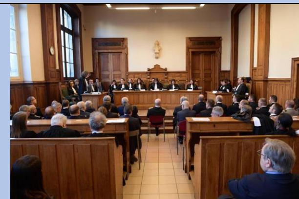
Un tribunal judiciaire